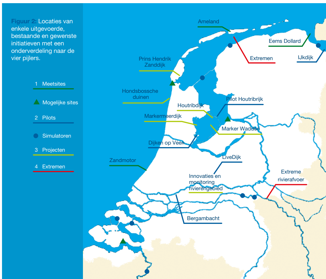
Figuur 2: Locaties van enkele uitgevoerde, bestaande en gewenste initiatieven met een onderverdeling naar de vier pijlers.